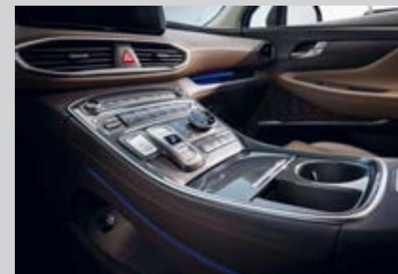
Cần số điện tử dạng nút bấm cùng đèn viền ambient light