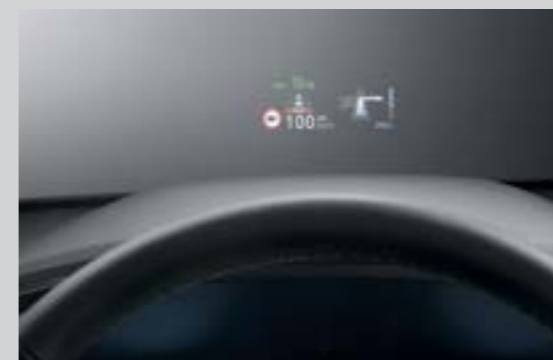
Hiển thị thông tin trên kính lái HUD (Bản Cao cấp)