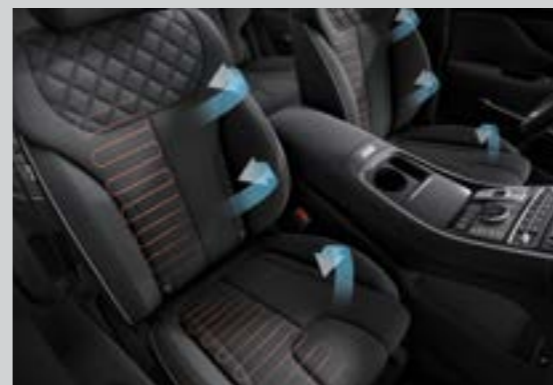
Làm mát và sưởi hàng ghế trước (Bản Đặc biệt và Cao cấp)