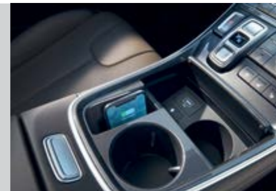
Sạc không dây chuẩn Qi