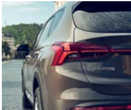
Đèn hậu công nghệ LED 3D

Đèn định vị ban ngày (DRL) tạo hình chữ T kéo từ nắp capo xuống hết cụm đèn chiếu sáng