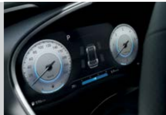
Màn hình thông tin digital 12.35 inch (Bản Đặc biệt và Cao cấp)