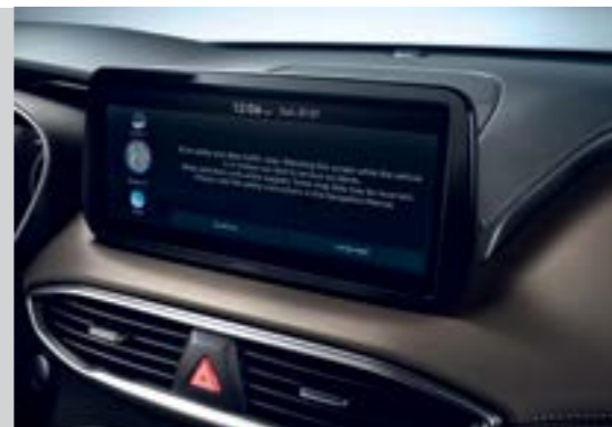
Màn hình giải trí 10.25 inch

Không gian nội thất của New Santa Fe là sự kết hợp hoàn hảo của sự sang trọng cùng với công nghệ hiện đại mang đến cho khách hàng sự tiện nghi thoải mái