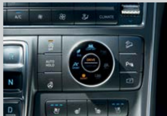
4 chế độ lái (Eco, Comfort, Sport, Smart)