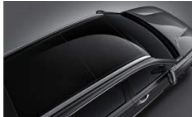
Cửa sổ trời toàn cảnh Panorama cùng thanh treo giá nóc (Bản Đặc biệt và Cao cấp)