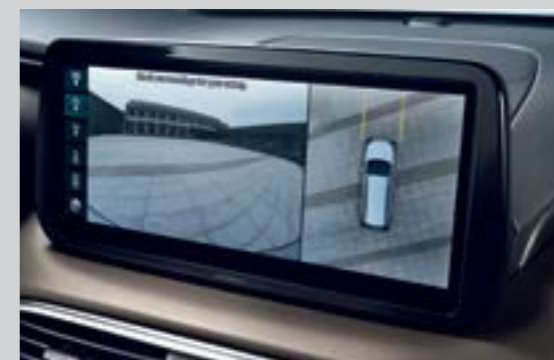
Hệ thống camera 360° (Bản Cao cấp)